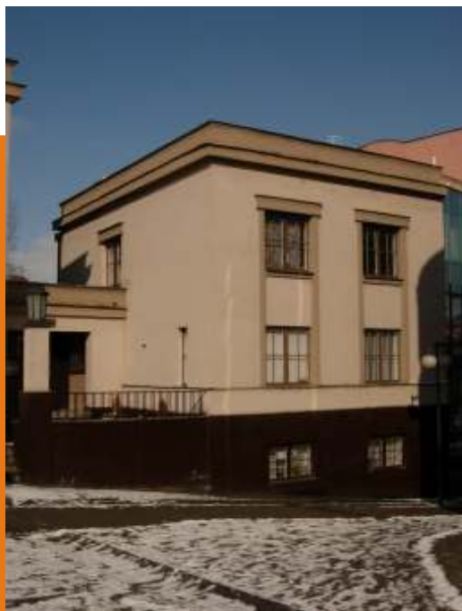
St edisko pro konzultaci a prevenci