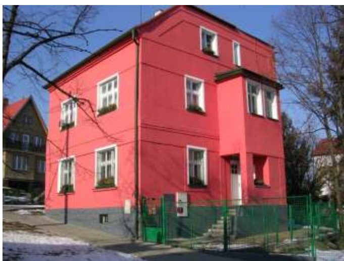
St edisko následné pé e - Chrán né bydlení