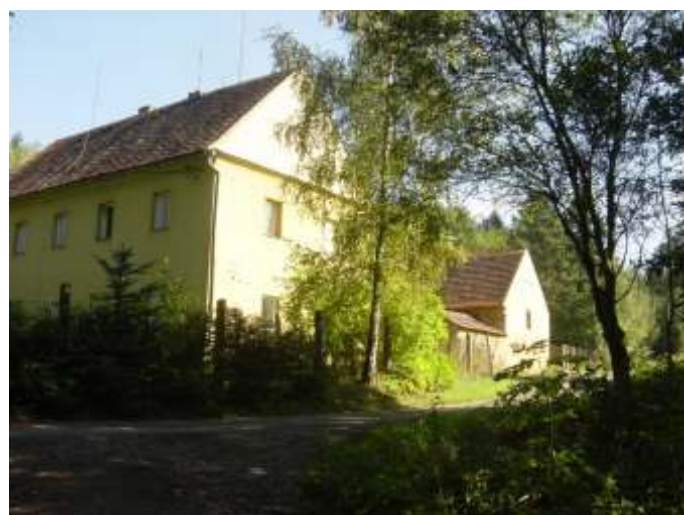
Terapeutická komunita Vrší ek